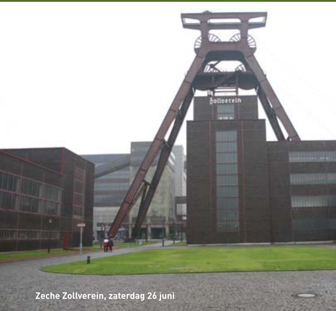
Zeche Zollverein, zaterdag 26 juni